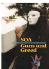
La Escuela de las Américas: Armas y Avaricia (video)

Nominado para un Oscar. El video documenta la responsabilidad de militares de América Latina,